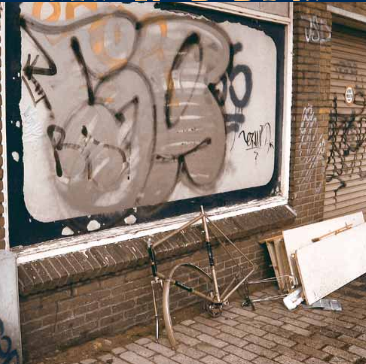
Sociale teams Leeuwarden